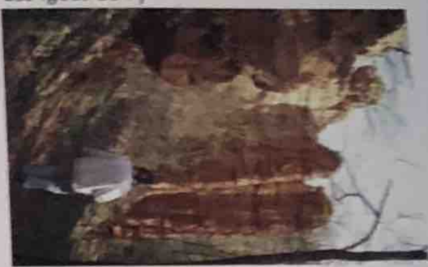
Les Igues du Py

Situation : Après Lanuéjols (direction Rignac D 1), prendre à droite direction Compolibat. Parking : Sur la place du village.