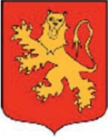
Blason de l'Aveyron