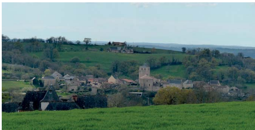
Panoramique de Peyrusse le Roc vu du Moulin

Le moulin du Montet ou légendaire « moulin sans ailes » propriété privée, permet d'avoir une vue panoramique sur le site moyenâgeux de Peyrusse-le-roc. Construit en 1843 par la famille Bex sur le point culminant de la colline (492m), le moulin à vent n'a jamais fonctionné.